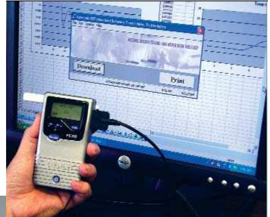
Use el software Datatrak de Lifeloc