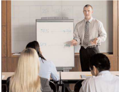
Programas de entrenamiento y certificación

Opciones de impresión: Escoja entre impresión directa o interfase con PC DataTrak Tres modos de prueba: automático, manual y pasivo Numerosas opciones adicionales seleccionables por el usuario