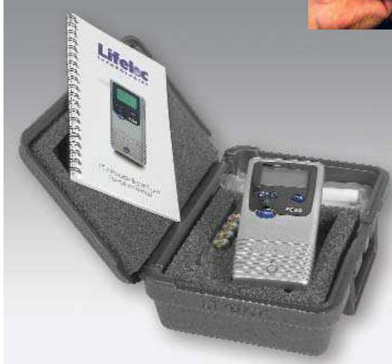
Lifeloc's FC20 con maletín